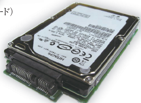
SOPSS-O2 (2.5inch HDD対応)

SOPSS (SoINac PATA/SATA Solution) は、高度な信頼性を必要とするシステム向けに、産業用機器製造基準で製造された「PATA-SATA変換ボード/ドライブ」(SOPSS-D/SOPSS-O2は、弊社「Non-Stop HDD」を搭載)