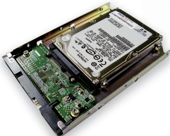
SOPSS-D (3.5inch HDD対応)